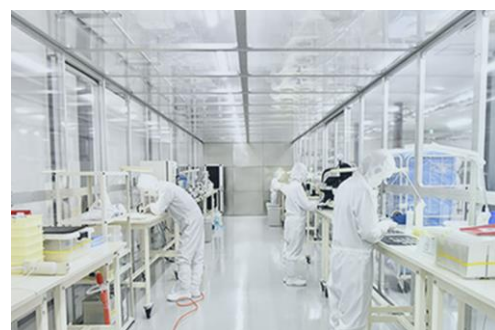
ISOクラス1 スーパークリーンルームでの 日本国内製造