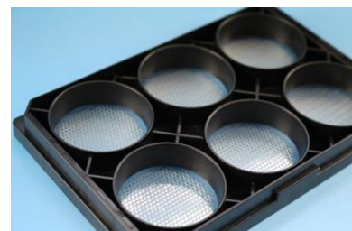
細胞培養プレート